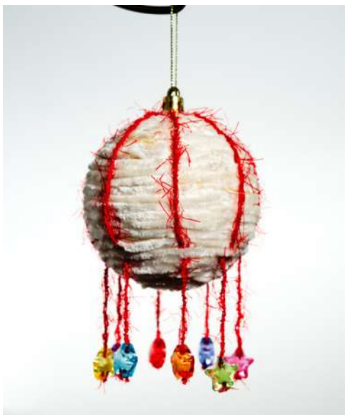
Bombka - kula styropianowa, włóczka, koraliiki