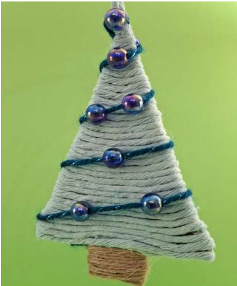
Choinka - karton makulaturowy, sznurek do makramy, sznurek jutowy, koraliki