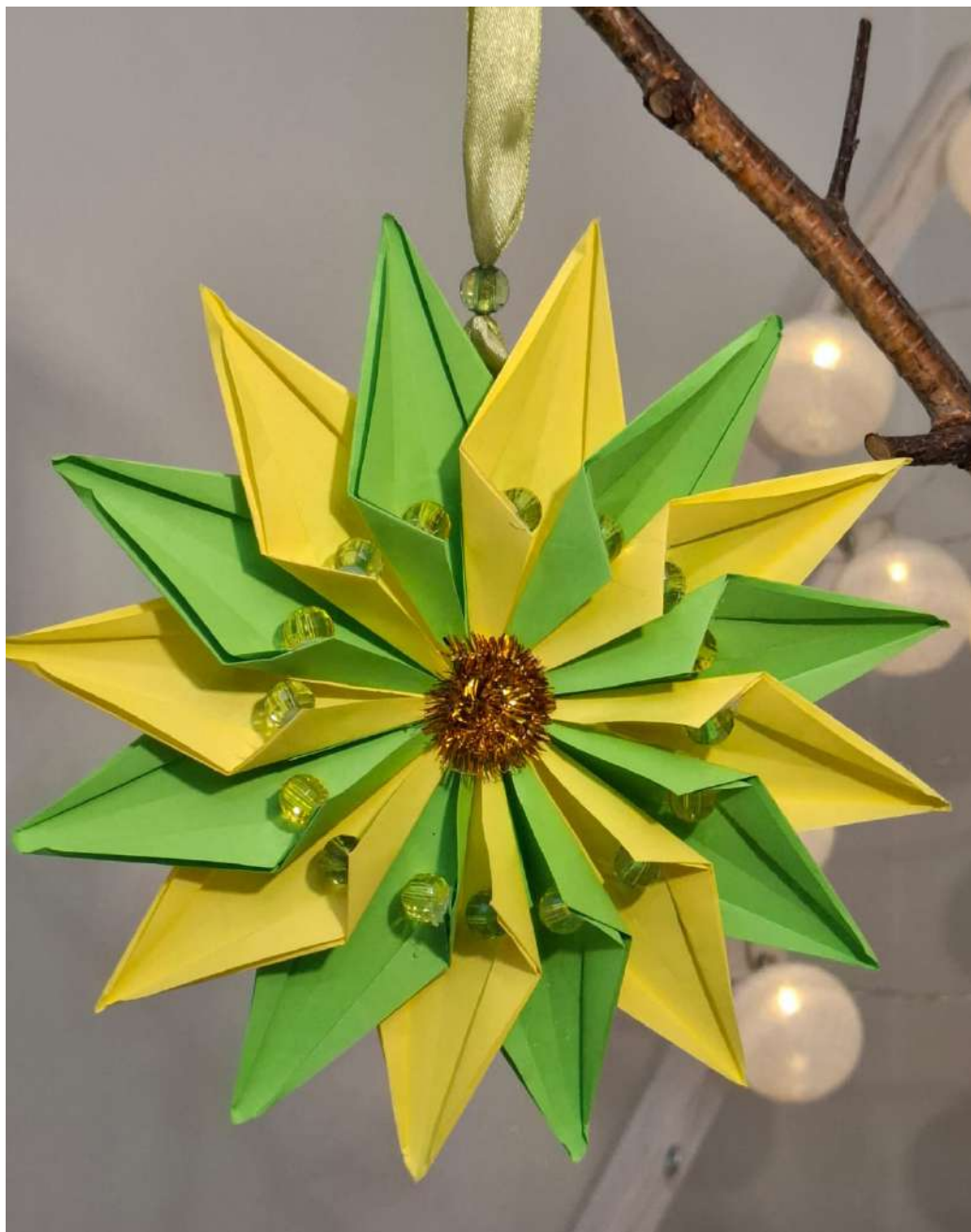
Gwiazda - żółty i zielony papier rysunkowy, spiralka welurowa, koraliki, karton makulaturowy