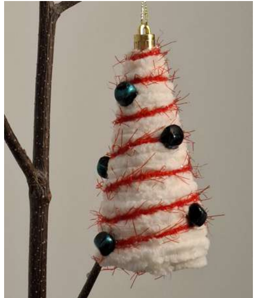
Choinka - styropianowy stożek, włóczka szenilowa, włóczka, koraliki