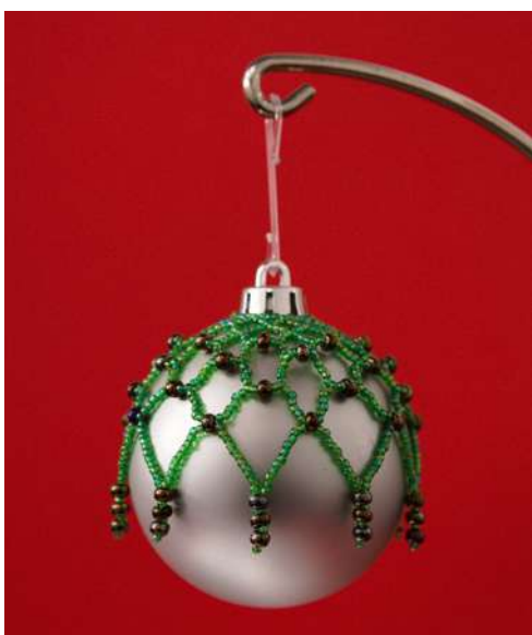
Koszulka na bombkę: koraliki, nić nylonowa