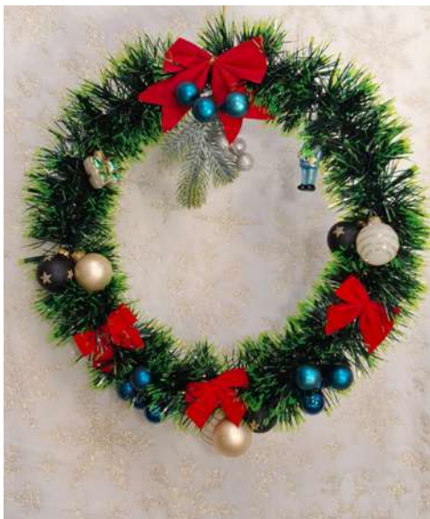
Wianuszek – duża ozdoba świąteczna na drzwi: sztuczny łańcuch choinkowy, bombeczki szklane, wstążka