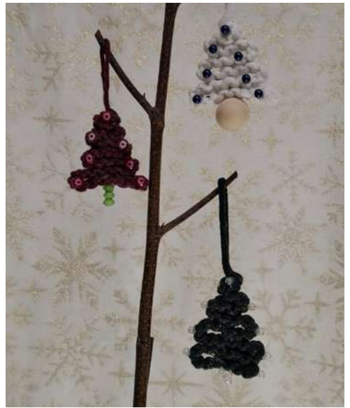
Choineczki - sznurek do makramy, koraliki