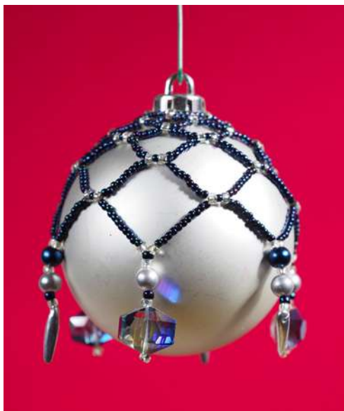
Koszulka na bombkę: koraliki, nić nylonowa