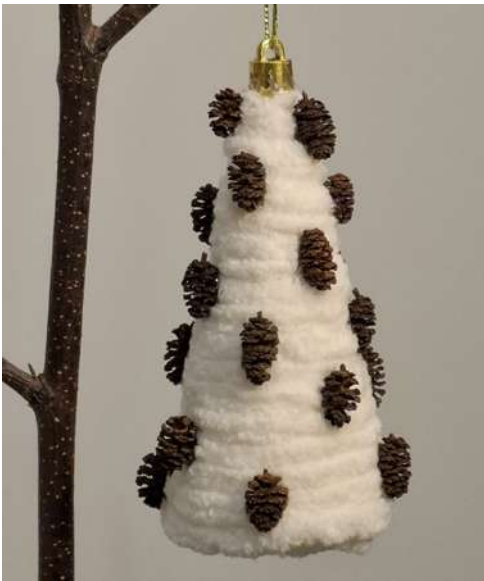
Choinka - styropianowy stożek, włóczka szenilowa, szyszczyki olchowe