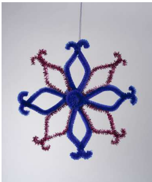
Śnieżynka - spiralka welurowa