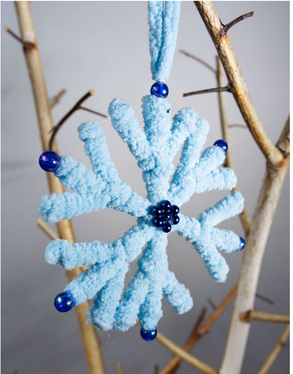
Śnieżynka - patyczki higieniczne, włóczka szenilowa, koraliiki