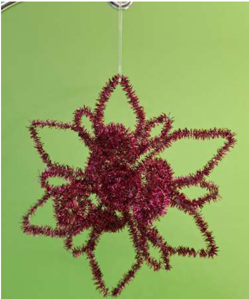
Gwiazdka - spiralka welurowa