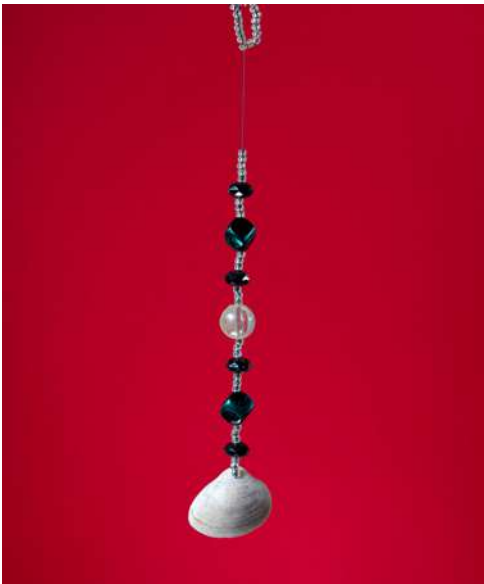
Ozdoba choinkowa: muszla naturalna bałtycka, koraliki, nić nylonowa