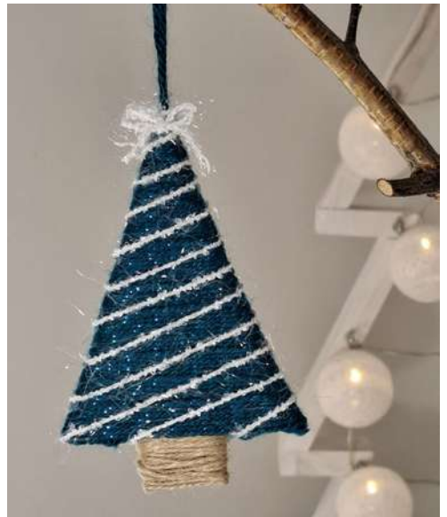
Choinka - karton makulaturowy, włóczka, sznurek jutowy