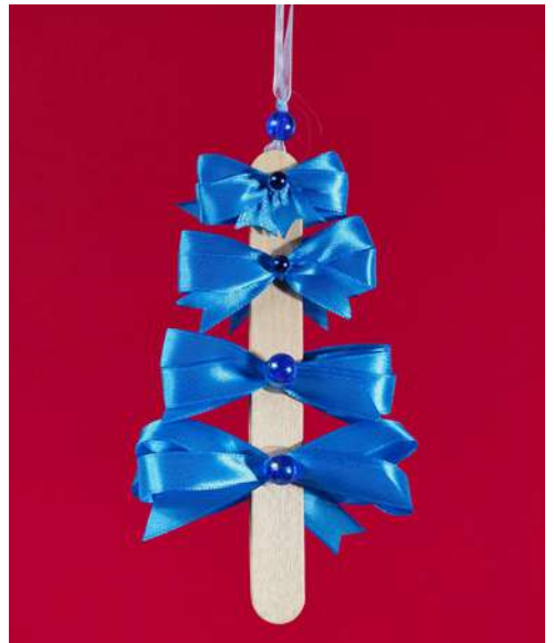
Choinka - drewniana szpatułka laryngologiczna, wstążka, koraliki