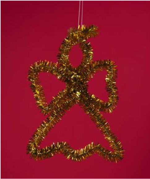
Aniołek - spiralka welurowa