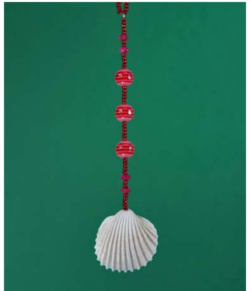
Ozdoba choinkowa: muszla naturalna bałtycka, koraliki, nić nylonowa