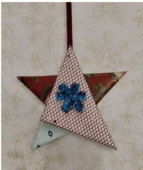
Gwiazdka - karton makulaturowy, końcówki papieru pakowego świątecznego, spiralka welurowa