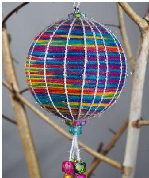
Bombka - okula styropianowa, włóczka, koraliiki