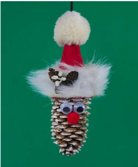
Mikołaj - szyszka świerkowa, karton makulaturowy z pojemnika na jajka, sztuczne futerko, pompon welurowy, szyszczyki olchowe