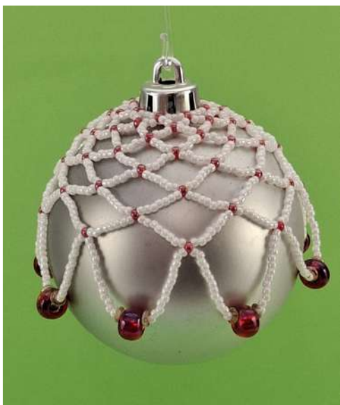
Koszulka na bombkę: koraliki, nić nylonowa