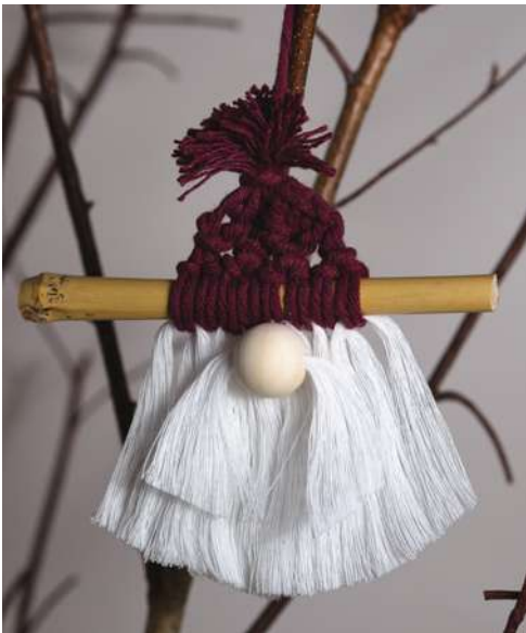
Mikołaj - sznurek do makramy, gałązka bambusowa