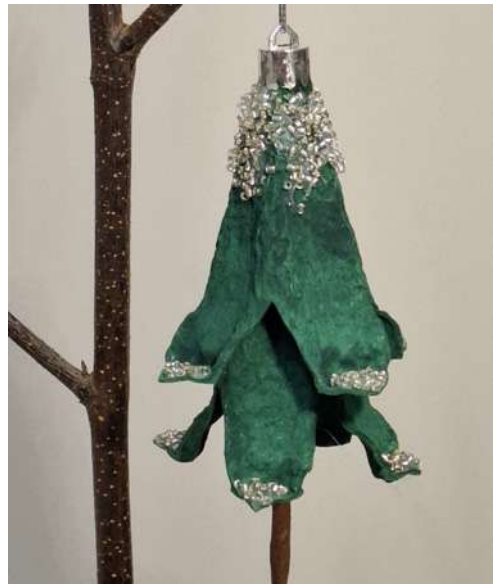
Choinka - karton makulaturowy z pojemnika na jajka, drut, brązowa bibuła gładka, koraliki