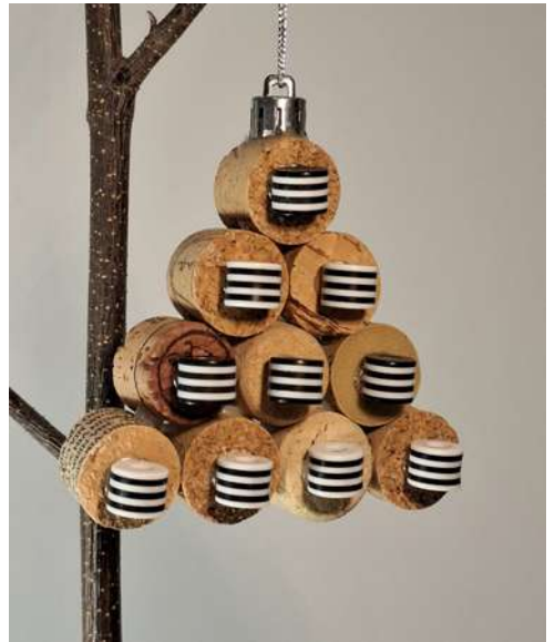
Choinka - korek od wina, koraliki