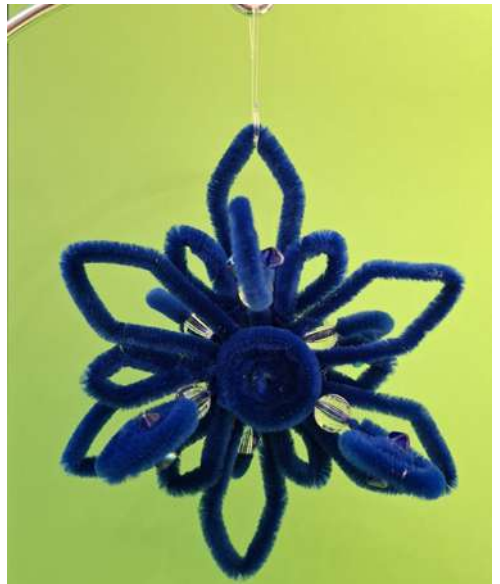
Gwiazdka - spiralka welurowa, koraliki