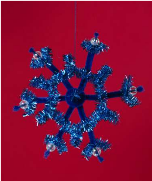
Śnieżynka - spiralka welurowa, koraliki