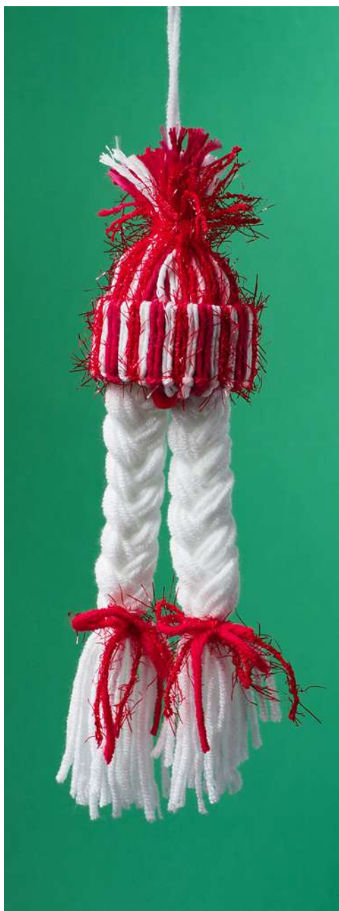
Elfka Pomocnica Mikołaja - rurka z rolki papieru toaletowego, włóczka, pompon welurowy