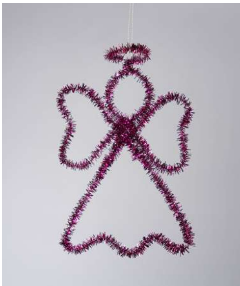
Aniołek - spiralka welurowa