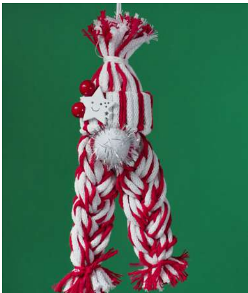
Elfka Pomocnica Mikołaja - rurka z rolki papieru toaletowego, włóczka, koraliki, drewniana gwiazdka, pompon welurowy