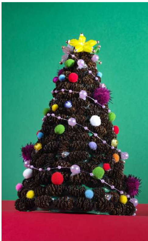
Choinka - duża ozdoba świąteczna stojąca: karton zielony techniczny, szyszeczki olchowe, koraliki, pompony welurowe