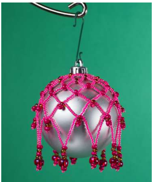
Koszulka na bombkę: koraliiki, nić nylonowa