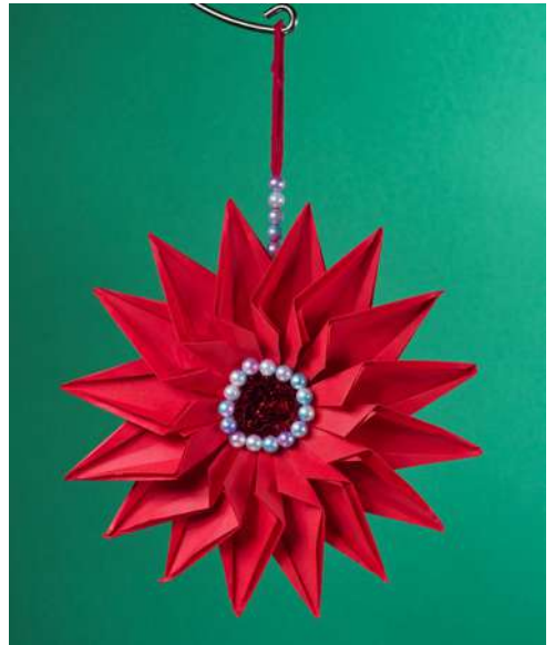
Gwiazda - czerwony papier rysunkowy, spiralka welurowa, koraliki, karton makulaturowy