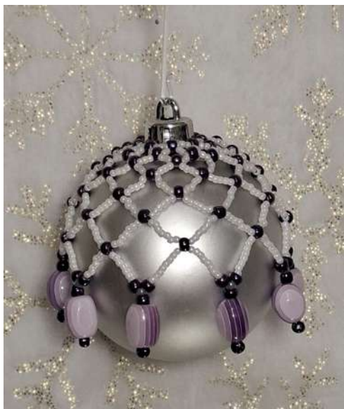
Koszulka na bombkę: koraliki, nić nylonowa