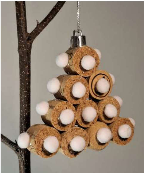
Choinka - korek od wina, pompony welurowe