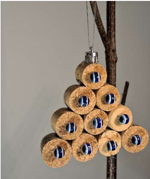
Choinka - korek od wina, koraliki