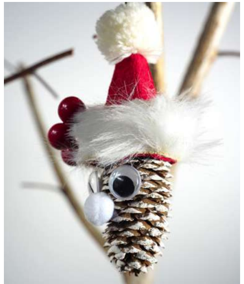
Mikołaj - szyszka świerkowa, karton makulaturowy z pojemnika na jajka, sztuczne futerko, pompon welurowy, koraliki