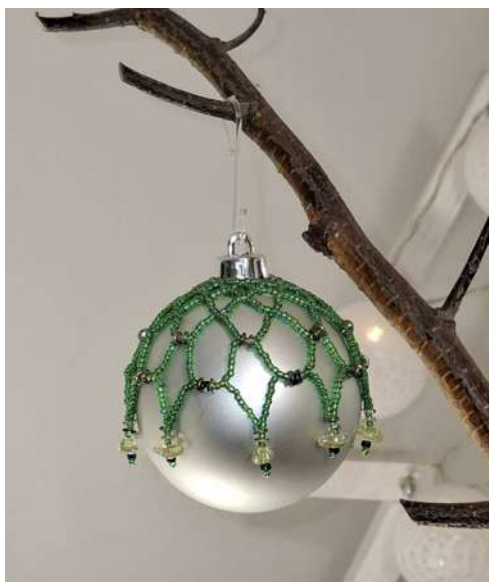
Koszulka na bombkę: koraliki, nić nylonowa