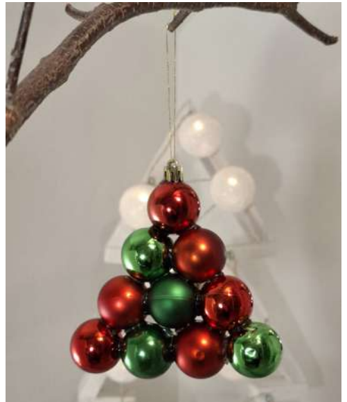
Choinka - bombeczek z tworzywa sztucznego