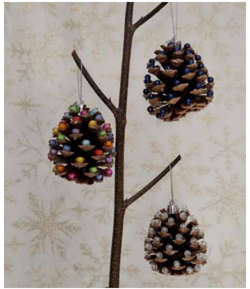
Choinka - szyszka sosnowa, koraliki