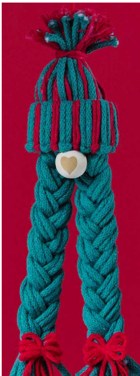
Elfka Pomocnica Mikołaja - rurka z rolki papieru toaletowego, sznurek do makramy, koralek drewniany