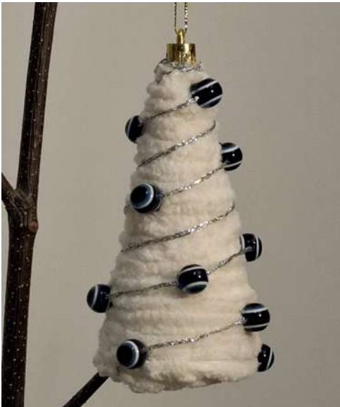
Choinka - styropianowy stożek, włóczka szenilowa, włóczka, koraliki