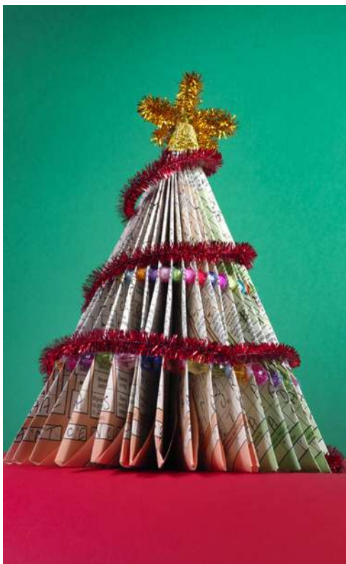
Choinka - duża ozdoba świąteczna stojąca: rozwiązane krzyżówki panoramiczne, koraliki, spiralka welurowa