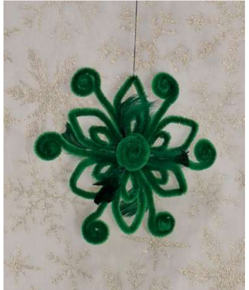
Gwiazdka - spiralka welurowa, sztuczne pióra