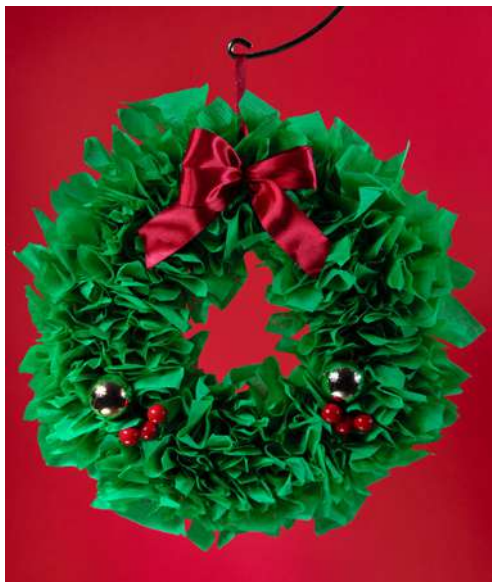
Wianuszek – duża ozdoba świąteczna na drzwi: karton makulaturowy, zielona bibuła karbowana, farba akrylowa, bombeczki z tworzywa sztucznego, koralki, wstążka, pompony welurowe, spiralka welurowa