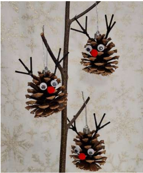
Reniferki - szyszka sosnowa, patyczki higieniczne, pompony welurowe, koraliki