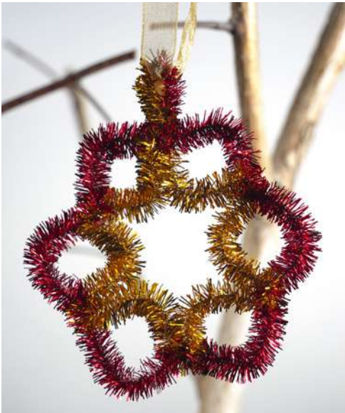
Śnieżynka - spiralka welurowa