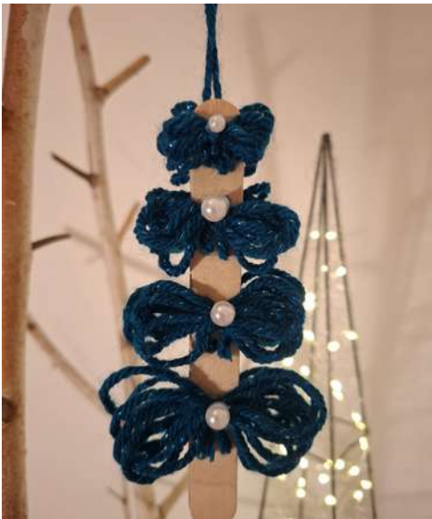
Choinka - drewniana szpatułka laryngologiczna, włóczka, koraliki