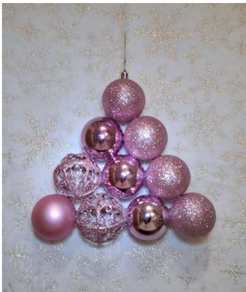
Choinka - duża ozdoba świąteczna na drzwi: bombki z tworzywa sztucznego