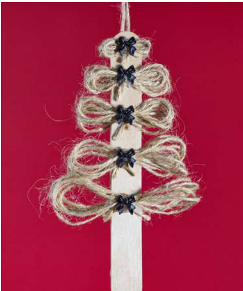
Choinka - drewniana szpatułka laryngologiczna, sznurek jutowy, koraliki w kształcie wstążek