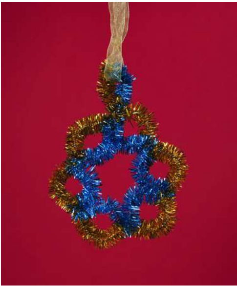
Śnieżynka - spiralka welurowa