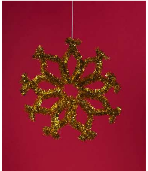
Śnieżynka - spiralka welurowa