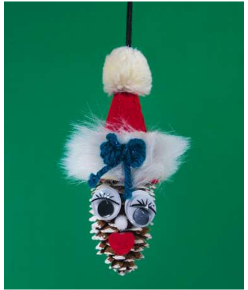
Mikołaj - szyszka świerkowa, karton makulaturowy z pojemnika na jajka, sztuczne futerko, pompon welurowy, włóczka