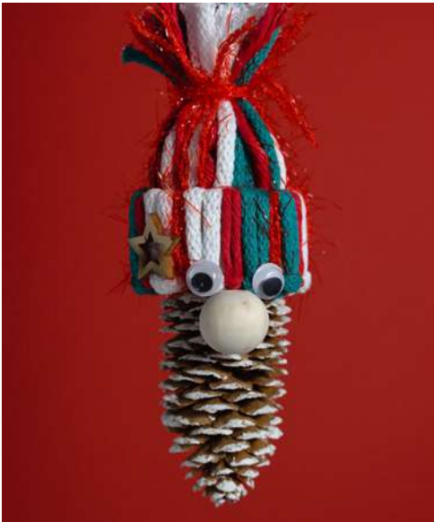
Mikołaj - szyszka świerkowa, sznurek do makramy, koralik drewniany