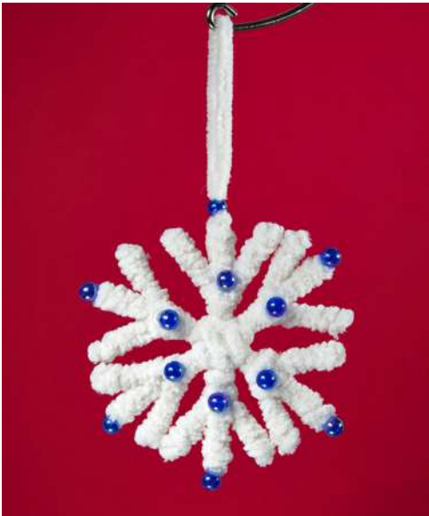
Śnieżynka - patyczki higieniczne, włóczka szenilowa, koraliki