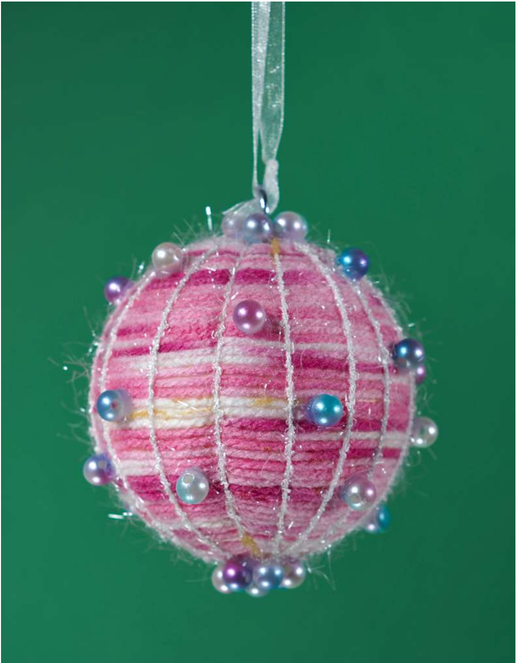
Bombka - kula styropianowa, włóczka, koraliiki