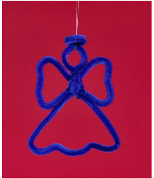
Aniołek - spiralka welurowa