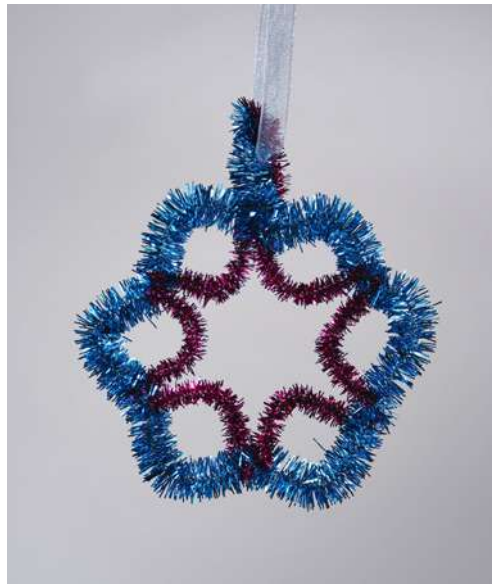
Śnieżynka - spiralka welurowa