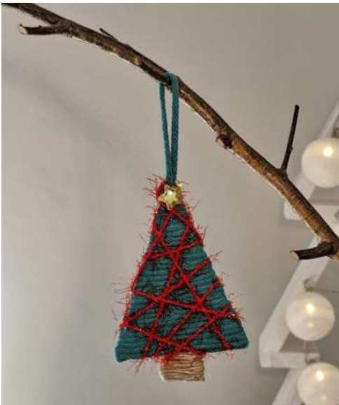
Choinka - karton makulaturowy, włóczka, sznurek jutowy, koralik