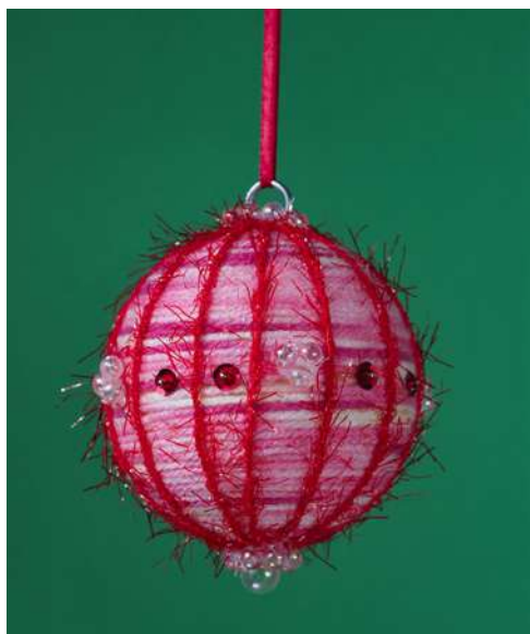
Bombka - kula styropianowa, włóczka, koraliiki