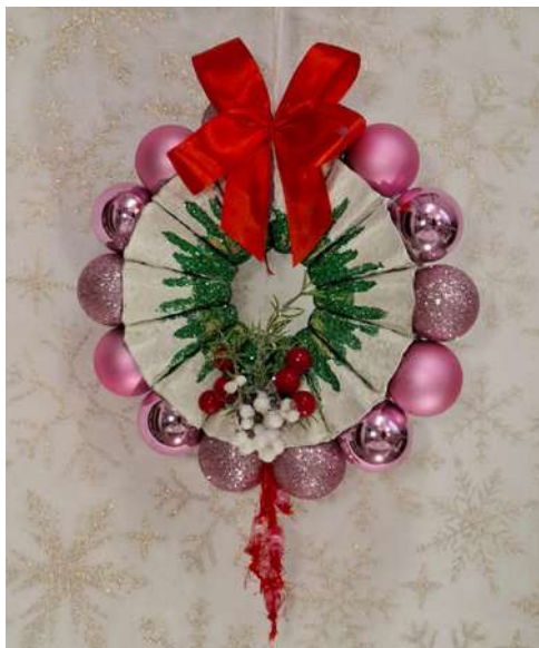
Wianuszek – duża ozdoba świąteczna na drzwi: karton makulaturowy z pojemnika na jajka, farba akrylowa, brokat, bombeczki z tworzywa sztucznego, koralki, wstążka, włóczka, pompony welurowe