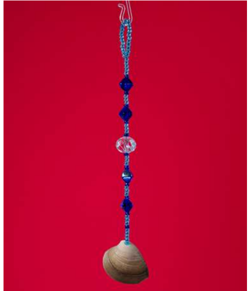
Ozdoba choinkowa: muszla naturalna bałtycka, koralki, nić nylonowa