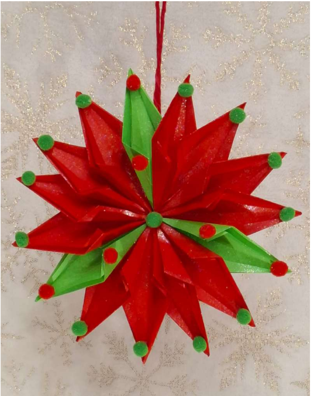
Gwiazda - czerwony i zielony papier rysunkowy, pompony welurowe, karton makulaturowy