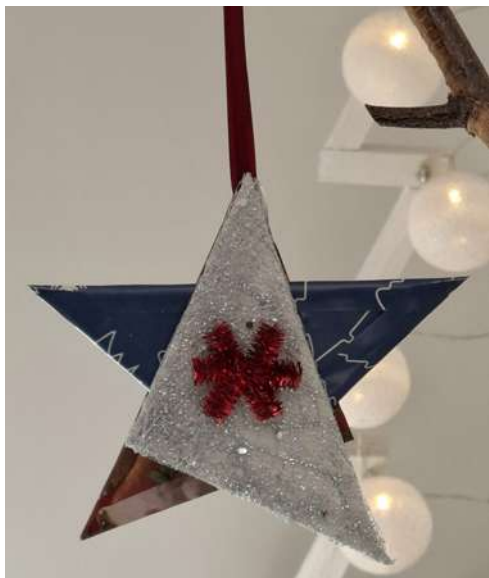
Gwiazdka - karton makulaturowy, końcówki papieru pakowego świątecznego, spiralka welurowa