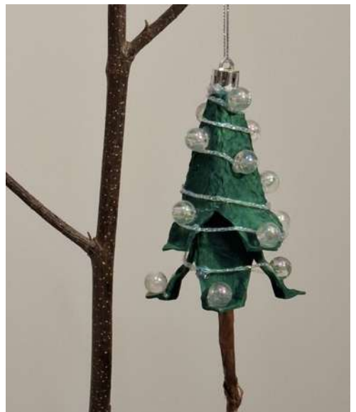
Choinka - karton makulaturowy z pojemnika na jajka, drut, brązowa bibuła gładka, włóczka, koraliki