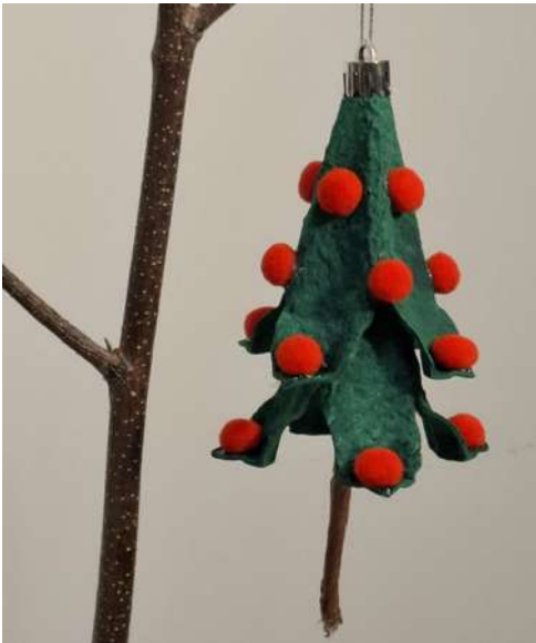
Choinka - karton makulaturowy z pojemnika na jajka, drut, brązowa bibuła gładka, pompony welurowe