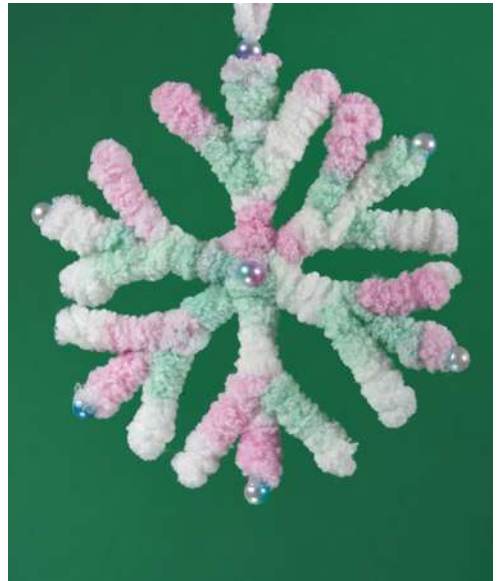
Śnieżynka - patyczki higieniczne, włóczka szenilowa, koraliki