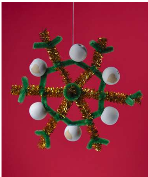
Śnieżynka - spiralka welurowa, welurowe pompony